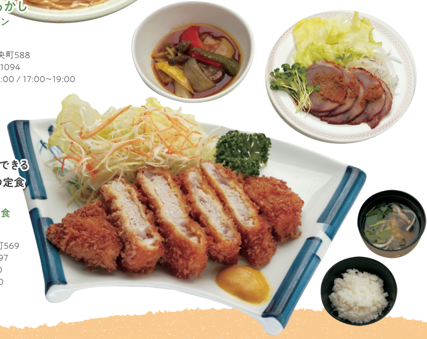
溪谷・味豚を堪能できる ボリューム満点の定食

DATA 03 所 上川町中央町573 ☎ 01658-7-7111 営 11:00~14:00 17:00~19:30 休 水曜