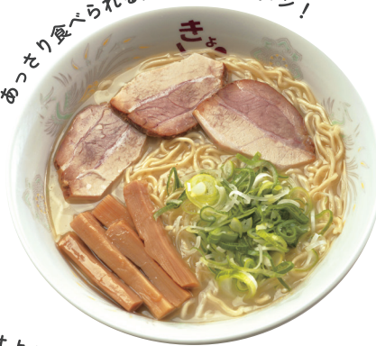
ガッツリ食べたいときはよし乃へ！