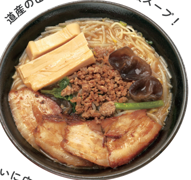
道産の田舎みそを使った特製スープ！