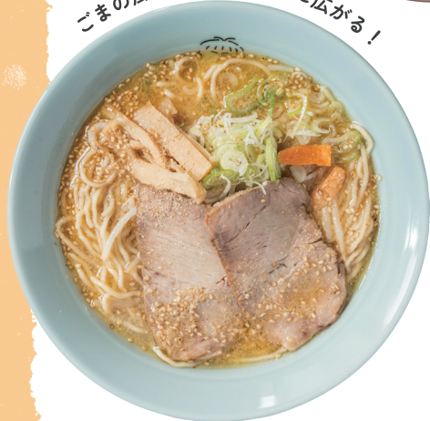
ごまの風味が口いっぱい広がる！

DATA 06 所 上川町中央町588 ☎ 01658-2-1094 営 11:00~14:00 / 17:00~19:00 休 日曜