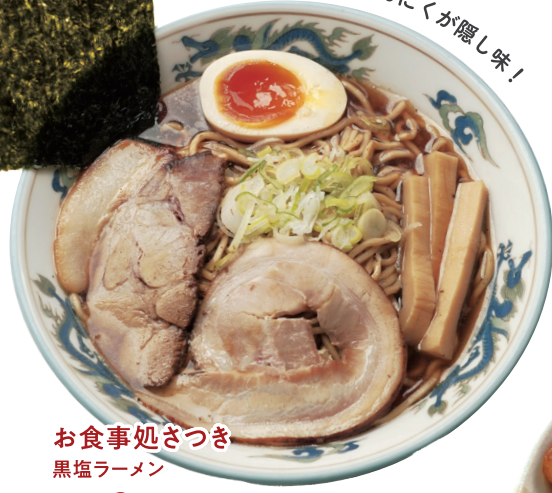
くさみのない黒にんにくが隠し味！

DATA 01 所 上川町南町135 ☎ 01658-2-1738 営 11:00~15:00 17:00~20:00 休 不定休