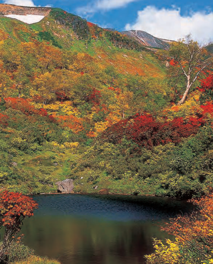
だれでもできる自然遊。高山植物、動物を大切り。